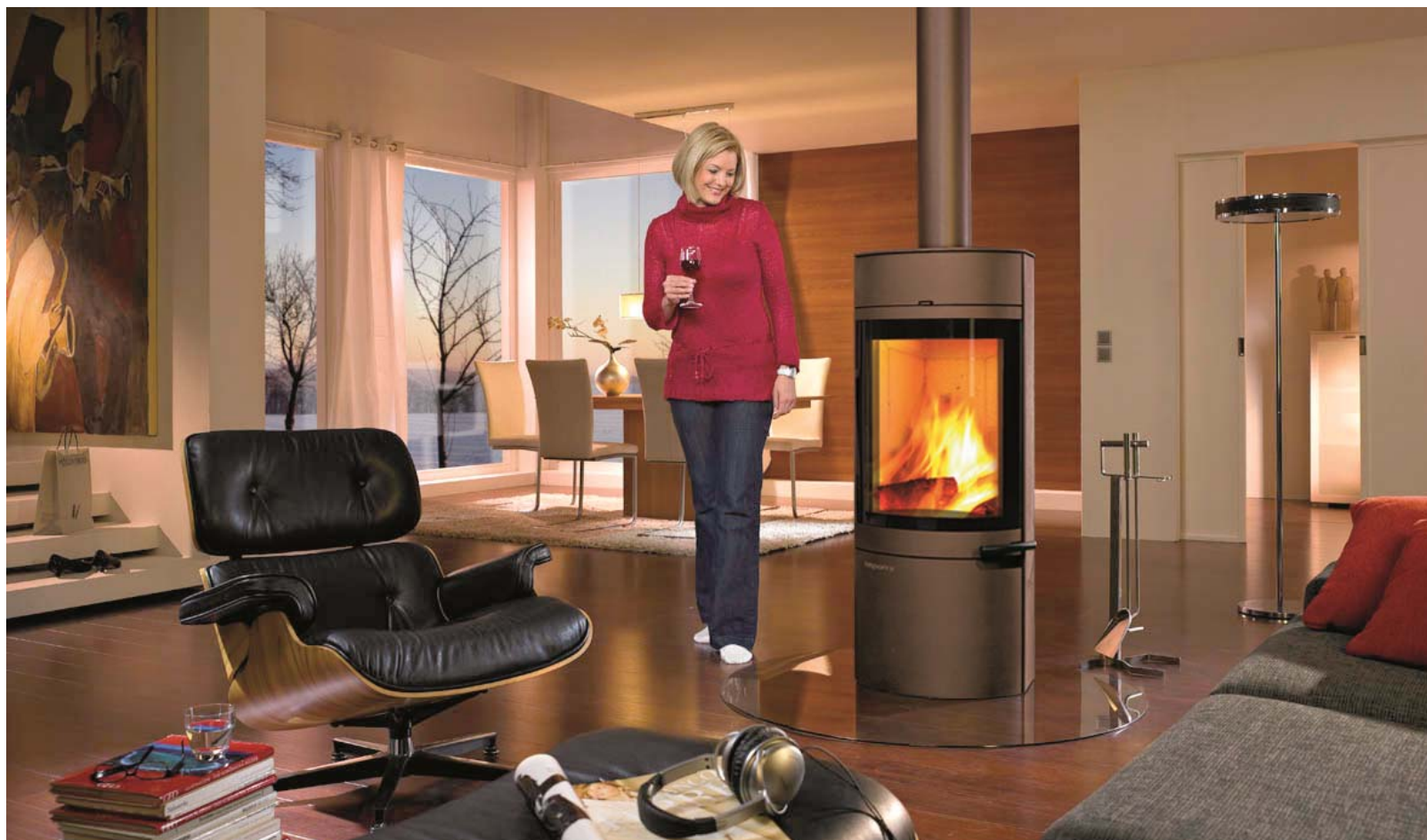
Brændeovnen ANDALO brun-metallic lakeret